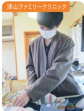
津山ファミリークリニック